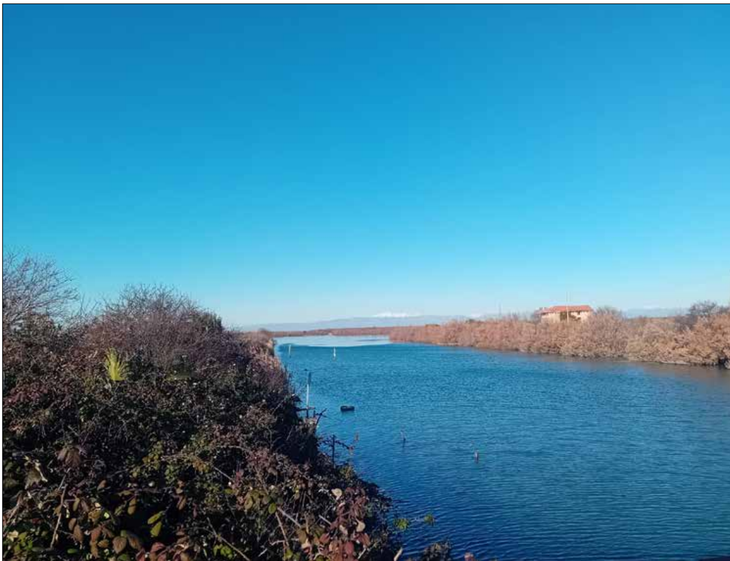
Canale all'interno dell'area della riserva

che sfocia in laguna con una bocca lagunare. Le bocche lagunari sono invece aperture naturali verso il mare aperto, ma spesso vengono modificate dall'attività umana e mantenute aperte dalle correnti marine. Le paludi sono invece delle aree che si trovano nella parte più settentrionale della riserva, hanno una profondità di 1-2 metri al di sotto del livello del mare e rimangono sommerse durante le escursioni di marea. Le valli da pesca consistono in porzioni lagunari appositamente arginate di estensione variabile e dotate di chiuse regolabili che mettono in condizione di comunicare, in base alle esigenze del momento, gli specchi d'acqua arginati rispetto al mondo esterno.