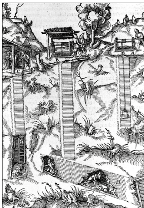
Pozzi e gallerie e tecniche di lavaggio del minerale nelle antiche illustrazioni di G. Agricola

mente fino al 1986 e fino al 30 giugno 1991, per poi chiudere definitivamente, mentre per la miniera del M. Avanza, dopo la chiusura avvenuta durante l'ultimo conflitto mondiale, vennero condotti dei nuovi sondaggi esplorativi negli anni compresi fra il 1985 e il 1992 ed opere di ammodernamento dei fabbricati di servizio, che tuttavia non ebbero poi seguito.