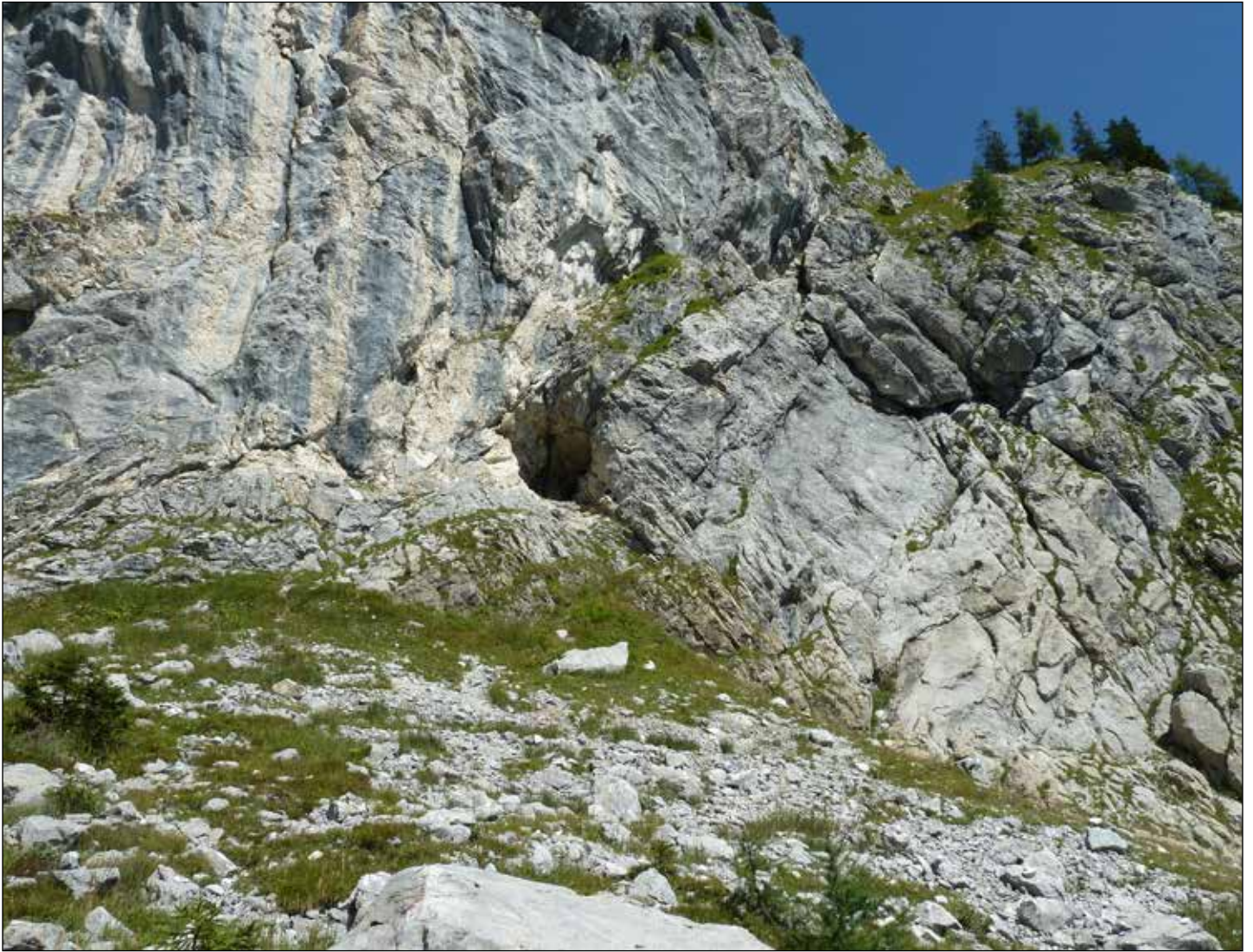
Imbocco della galleria medioevale presso la Cengia del Sole (parete Sud del M. Avanza) aperta in corrispondenza di una zona di faglia

tur Furno, cum omni adiacentia vel pertinentia sua, cum terris, casalis, pratis, pascuis, silvis, pomicientia, montibus, aquis, astalaris, casis, curtis, ferro et ramen... ". Appare chiaro quindi che l'atto di donazione cita, oltre a terre, pascoli, boschi, acque e abitati, anche attività minerarie già consolidate in quella località che oggi conosciamo come Forni Avoltri.