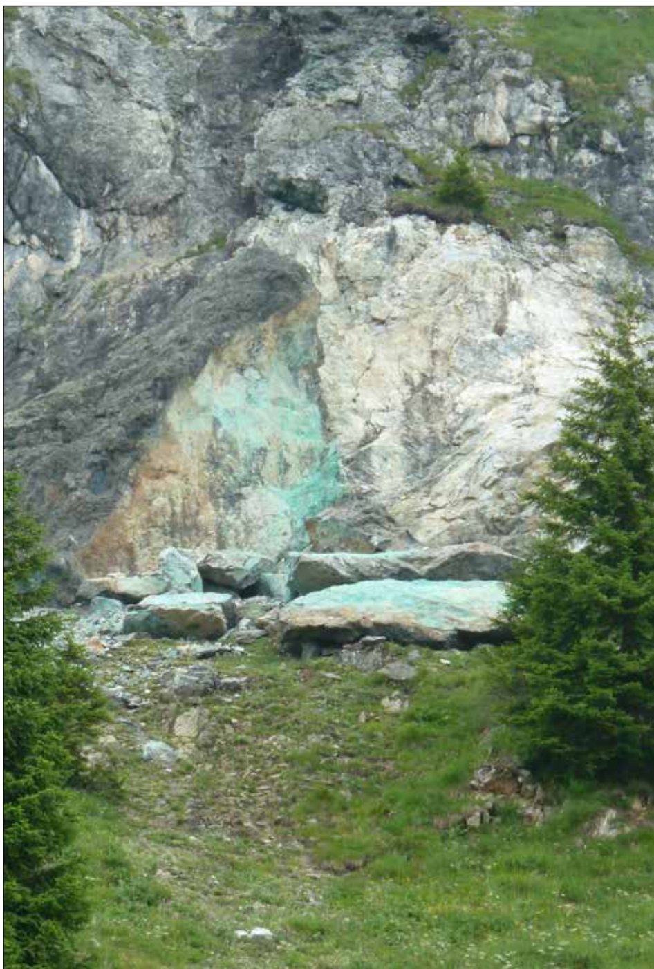
Placche di alterazione dei minerali contenenti rame sulla parete Sud del M. Avanza

più importanti e note, in quanto tali documenti si limitavano a indicare in maniera sommaria delle località senza idonee planimetrie a corredo, che comunque, stante le rudimentali tecniche di rilievo dell'epoca, non disporrebbero del livello di precisione al quale oggi siamo abituati. Di questi documenti, uno dei più antichi risale all'anno 778 e testimonia la donazione da parte dei Franchi al Monastero di Sesto al Reghena di una "...villam quae est in montaneis que dici-