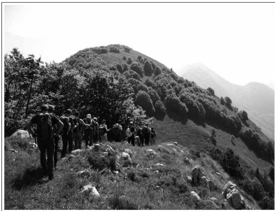
(Cresta M. Guarda, archivio Buja)

Allora continuiamo ad impegnarci per far conoscere a chi si vuole avvicinare alla montagna un approccio completo, non incentrato sulla competizione, ma avente ad oggetto principalmente la conoscenza della montagna in tutte le stagioni e sotto ogni aspetto, compreso i rischi che ne derivano.