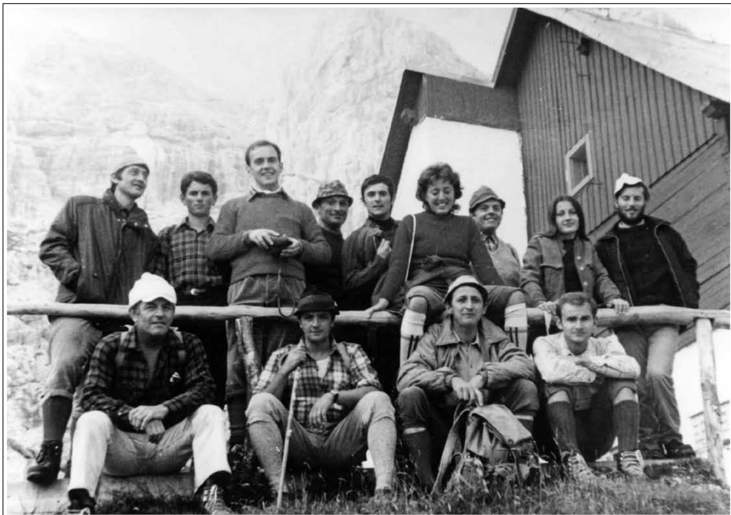
(Corsi, 1971, archivio Buja)